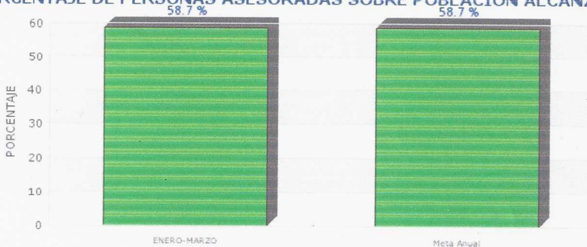
Gráfica de Indicador PORCENTAJE DE PERSONAS ASESORADAS SOBRE POBLACIÓN ALCANZADA